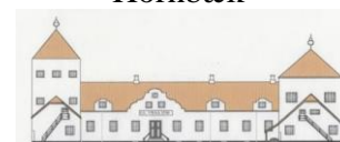
VRAA SLOT Tylstrup

Restrup Kærvej 10 DK-9240 Nibe Tlf. +45 98 34 18 88 book@slotshotel.dk www.slotshotel.dk