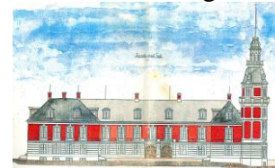
HVEDHOLM SLOT Faaborg