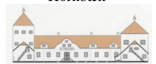
VRAA SLOT Tylstrup

Restrup Kærvej 10 DK-9240 Nibe Tlf. +45 98 34 18 88 book@slotshotel.dk www.slotshotel.dk