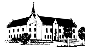
KOKKEDAL SLOT Brovst