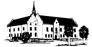
KOKKEDAL SLOT Brovst